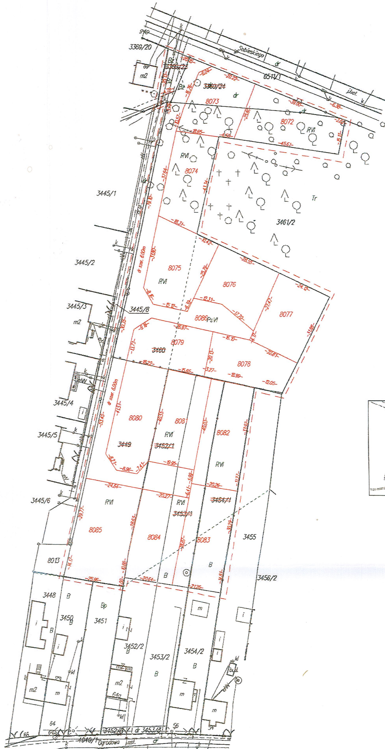
Szkic orientacyjny Skala 1:20000